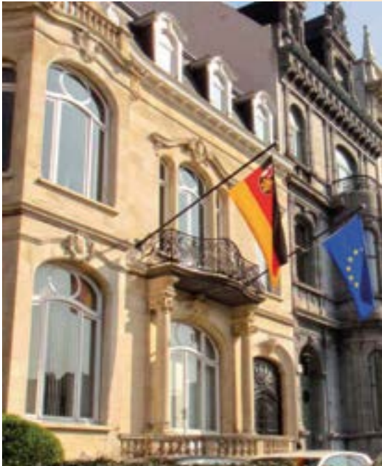
Die Vertretung des Landes Rheinland-Pfalz in der Avenue de Tervuren in Brüssel.

Hier kann man sich zum Newsletter anmelden: https://europa.rlp.de/