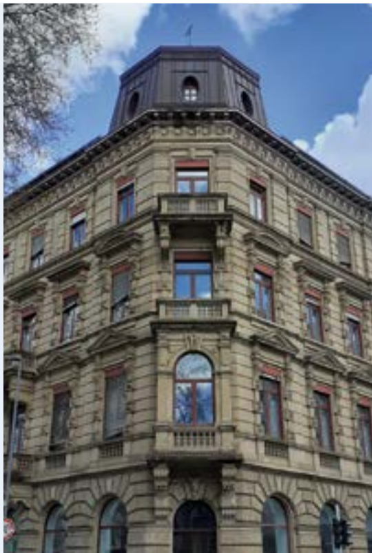
Die Landeszentrale für politische Bildung Rheinland-Pfalz mit neuem Sitz in der Kaiserstraße 22 in Mainz.

Die Europabildung ist - zusammen mit der Information über internationale politische Zusammenhänge - eine wichtige Aufgabe der Landeszentrale für politische Bildung Rheinland-Pfalz (LpB). Die Verfassung für Rheinland-Pfalz hebt als eine Aufgabe des Landes hervor, die europäische Vereinigung zu fördern und bei der Europäischen Union mitzuwirken, die demokratischen, rechtsstaatlichen, sozialen und föderativen Grundsätzen und dem Grundsatz der Subsidiarität verpflichtet ist (Artikel 74a LV).