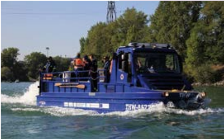
„Lurchi“ im Wasser

Rheinland-Pfalz hat gemeinsame Grenzen mit Belgien, Luxemburg und Frankreich und fördert mit Partnern aus diesen Regionen über die grenzüberschreitenden Interreg A-Programme „Großregion“, „Oberrhein“ und „Maas-Rhein“ eine Vielzahl an grenzüberschreitenden Projekten. Jedes Programm hat unterschiedliche Fördergebiete sowie thematische Schwerpunkte und dient vor allem der Reduzierung von Entwicklungsunterschieden, dem Erhalt einer guten Zusammenarbeit und zur Erschließung vorhandener Potenziale. Das EU-Förderprogramm Interreg A fördert seit mittlerweile über 30 Jahren grenzüberschreitende Kooperationen zwischen lokalen und regionalen Partnern aus den verschiedenen Gebieten.