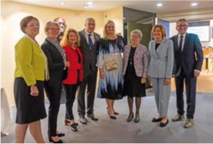
Spitzen des interregionalen 4er-Netzwerks

Burgund-Franche-Comté und der tschechischen Region Mittelböhmen blickt das sogenannte 4er-Netzwerk auf eine mittlerweile 20-jährige gefestigte Partnerschaft.