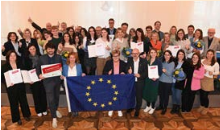
Zertifizierungs- feier neuer Europaschulen in Rheinland-Pfalz 2023

Außerdem zählt Rheinland-Pfalz mittlerweile 95 Europaschulen, die der Europabildung an ihren Schulen besonders viel Platz einräumen. Sie integrieren den europäischen Gedanken im Unterricht, sie weisen ein umfassendes Angebot an Fremdsprachen, europäische Partnerschulen und Austauschprogramme auf und führen regelmäßig kreative Schulprojekte mit europäischer Reichweite durch.