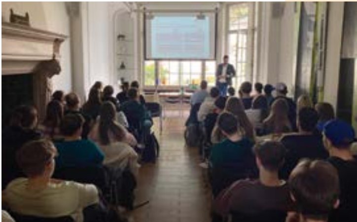
Schülerinnen und Schüler zu Besuch in der rheinland- pfälzischen Landesvertretung in Brüssel

Außerdem zählt Rheinland-Pfalz mittlerweile 95 Europaschulen, die der Europabildung an ihren Schulen besonders viel Platz einräumen. Sie integrieren den europäischen Gedanken im Unterricht, sie weisen ein umfassendes Angebot an Fremdsprachen, europäische Partnerschulen und Austauschprogramme auf und führen regelmäßig kreative Schulprojekte mit europäischer Reichweite durch.