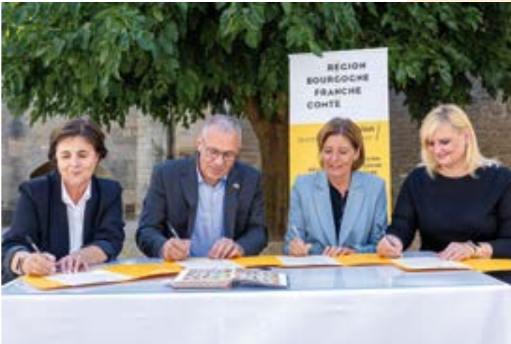
Unterzeichnung der Gemeinsamen Erklärung des 4er-Netzwerks im Oktober 2023