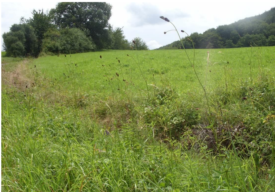
Foto 4: Saumstruktur mit Großem Wiesenknopf südlich Wolfstein – Flugstelle des Dunklen Wiesenknopf-Ameisenbläulings