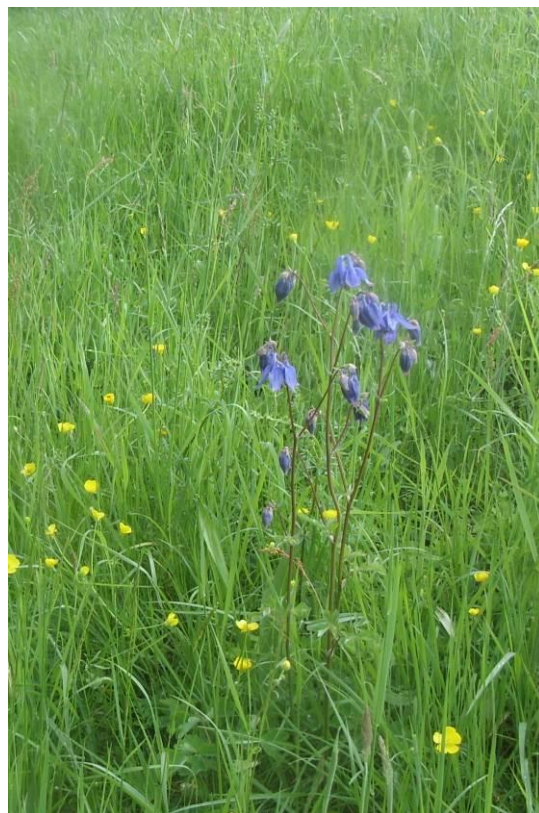
Foto 6: links: Breitblättriges Knabenkraut ( Dactylorhiza majalis); rechts: Gewöhnliche Akelei ( Aquilegia vulgaris) auf BT-6411-0081-2012