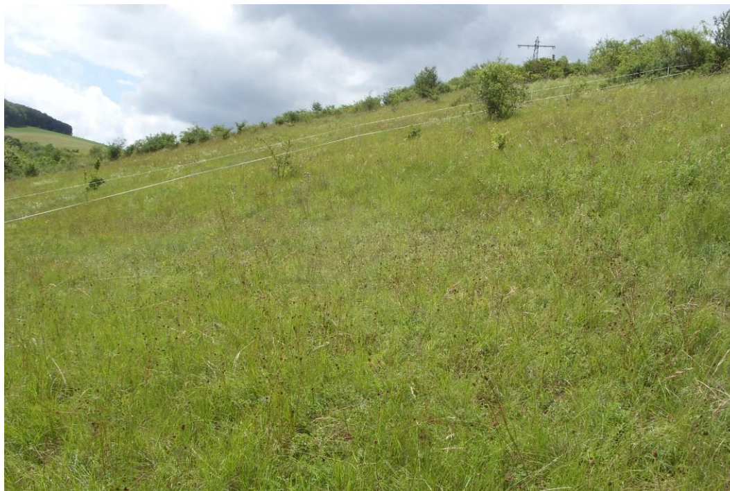
Foto 9: Trespen-Trockenrasen (LRT 6210) in der Kalkdell südwestlich des Reckweilerhofes, westlich von Tiefenbach – Habitat des Quendel-Ameisenbläulings ( Maculinea arion )