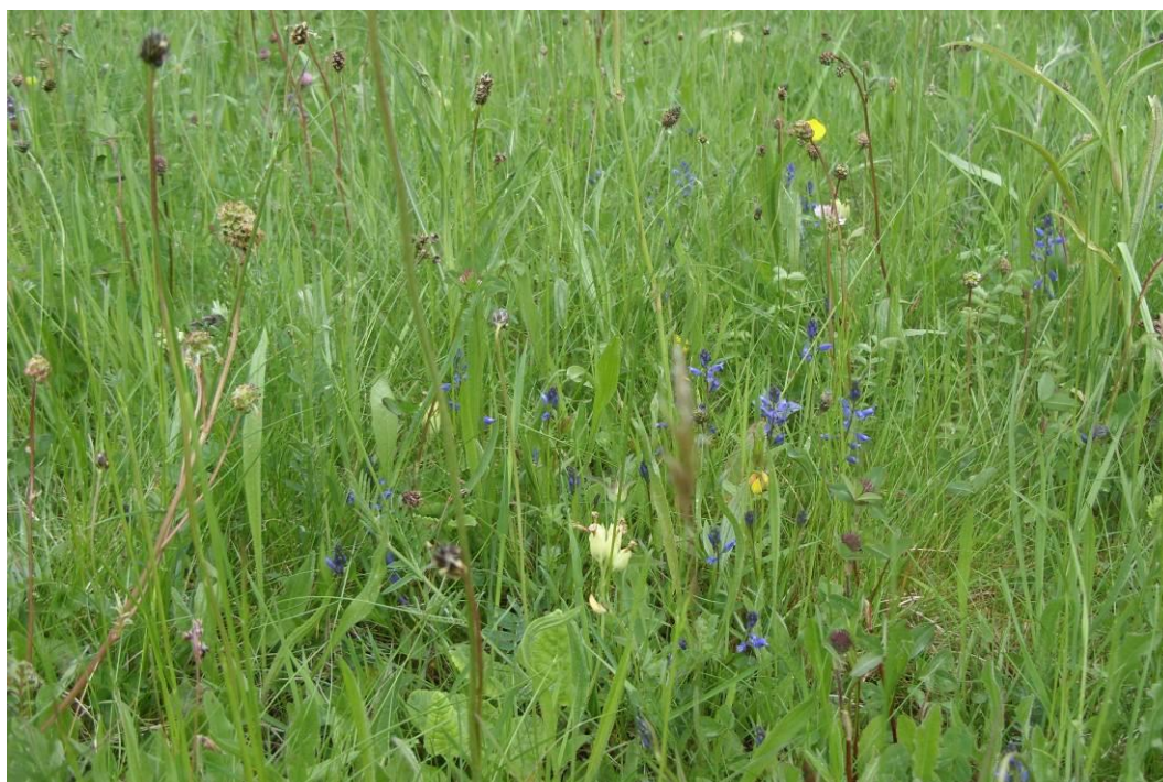
Foto 8: Detailansicht von BT-6411-0080-2012 mit Gemeinem Kreuzblümchen ( Polygala vulgaris), Kleinem Wiesenknopf ( Sanguisorba minor) und Wiesen-Schlüsselblume ( Primula veris)