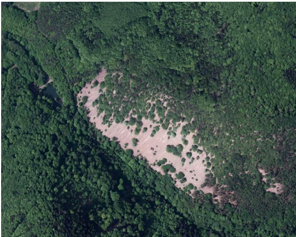
Foto 18: Luftbildaufnahme vom Leienberg bei Hinzweiler