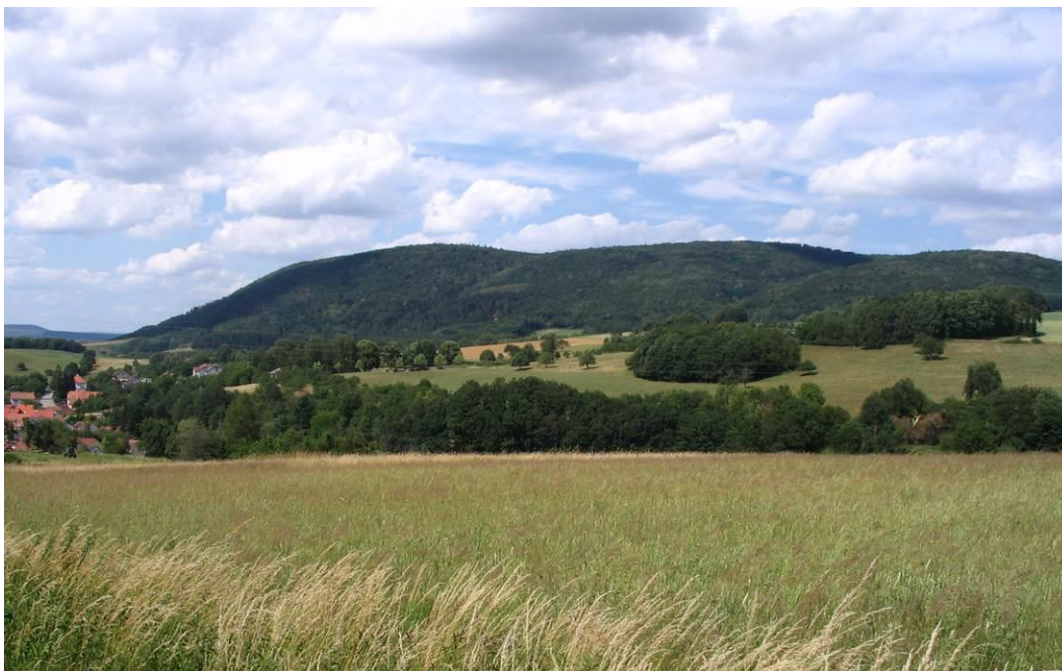
Foto 1: Der Königsberg von Westen