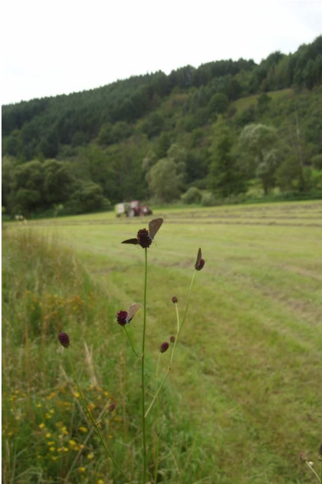
Foto 3: Dunkler Wiesenknopf-Ameisenbläuling, saugend an Großem Wiesenknopf in der Lauteraue zwischen Heinzenhausen und Tiefenbach (LAUB. – H. MIEDREICH. 2012)