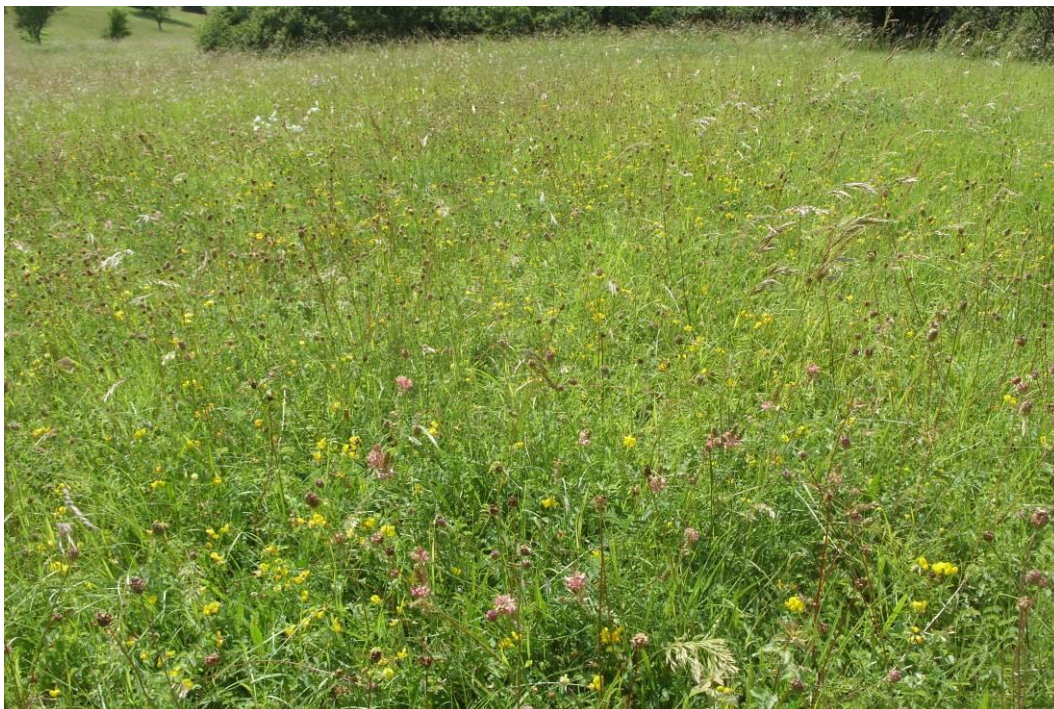
Foto 11: Trespen-Trockenrasen nordöstlich von Aschbach (BT-6311-0033-2012)