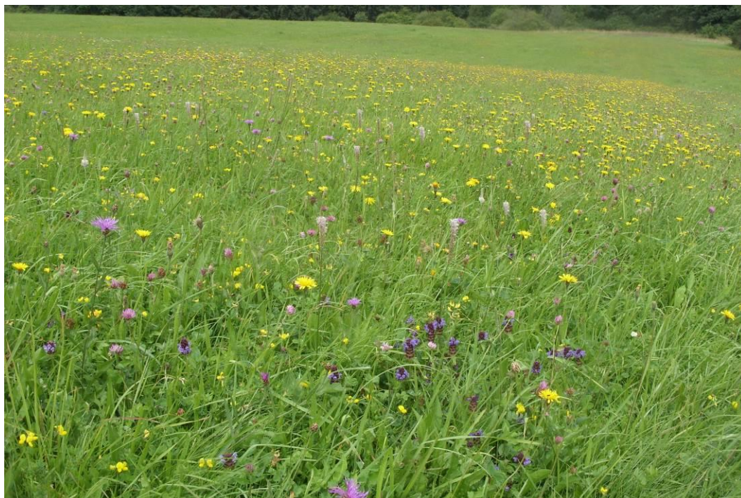
Foto 7: Wechsellrockene bis wechselfeuchte magere Flachland-Mähwiese am östlichen Königsberg, westlich von Rutsweiler – BT-6411-0080-2012