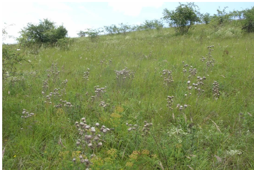
Foto 10: Trespen-Trockenrasen mit Carlina vulgaris (BT-6311-0024-2012)