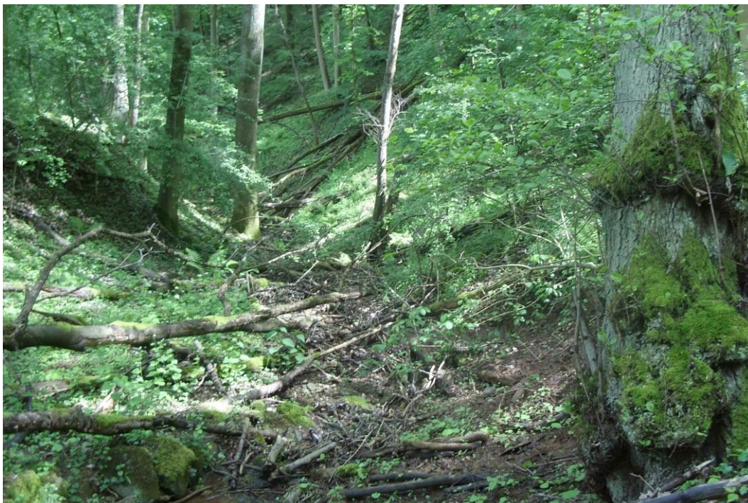
Foto 15: Bachbegleitender Eschenwald (LRT 31E0) am oberen Selbach, südlich von Wolfstein – BT-6311-0054-2012