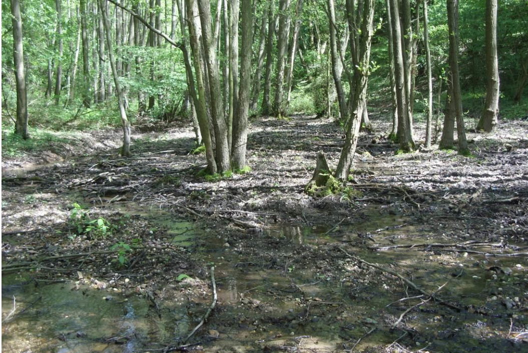
Foto 13: Erlen-Bachauenwald (LRT 91E0) am Taufenbach nordwestlich des Königsbergs, oberhalb von Hinzweiler (BT-6411-0051-2012)