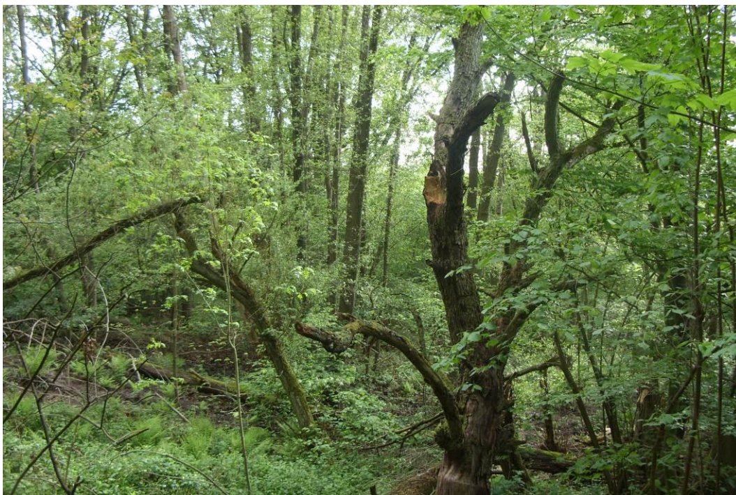
Foto 16: Bachbegleitender Erlenwald (LRT 91E0) in Quellbereich am Endersborn, östlich des Selbergs, südwestlich von Rutsweiler – BT-6311-0052-2012