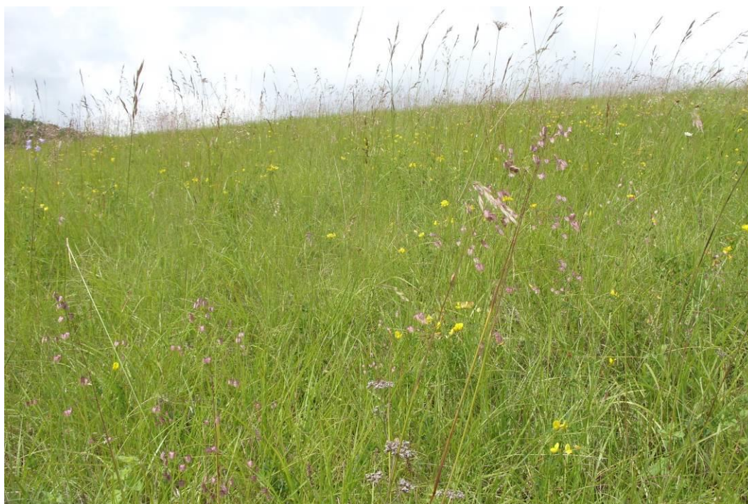
Foto 12: Trespen-Trockenrasen westlich von Tiefenbach (BT-6311-0033-2012)