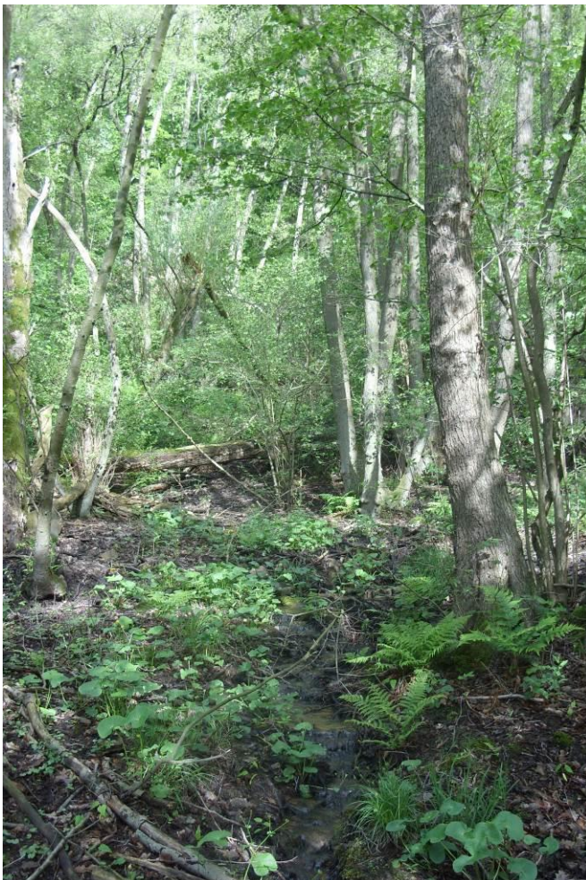
Foto 14: Erlen-Bachauenwald (LRT 91E0) östlich des Königsberges, westlich von Rutsweiler – BT-6311-0053-2012