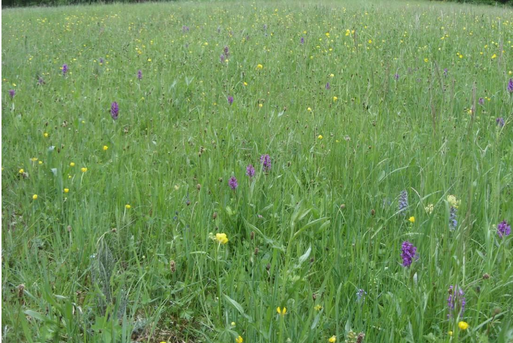
Foto 5: Magere Flachland-Mähwiese feuchter Ausprägung (LRT 6510) östlich Königsberg, westlich von Rutsweiler (BT-6411-0081-2012)