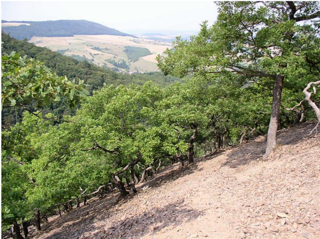
Foto 17: Schuttfuren mit Kruppeleichenwäldern am Leienberg ( naturschutz.rlp - Landschaften )